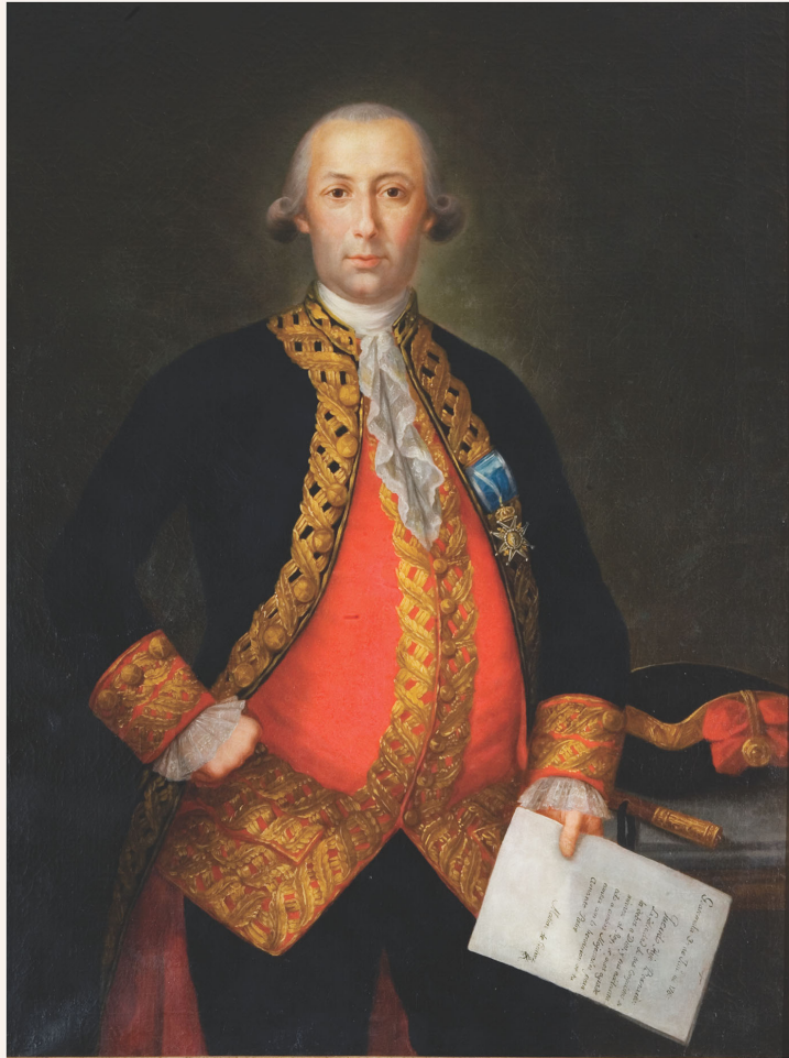
Bernardo de Gálvez, by Mariano Salvador Maella, 1784.

España jugó un papel crucial en la Guerra de Independencia de los Estados Unidos y contribuyó de forma decisiva al nacimiento de la nueva nación. En 2014, el Senado y la Cámara de Representantes de los Estados Unidos de América, en sesión conjunta, concedieron la ciudadanía honoraria a Bernardo de Gálvez, cuyas victorias contra el ejército británico en Pensacola, Florida, y Mobile, Alabama, constituyeron una ayuda fundamental al Ejército Continental. Es el reconocimiento más elevado que los Estados Unidos pueden conceder a una persona de otro país. Los Estados Unidos habían concedido la ciudadanía honoraria únicamente en siete ocasiones durante su historia. Gálvez fue “un héroe de la Guerra de Independencia que arriesgó su vida por la libertad del pueblo de los Estados Unidos y suministró provisiones, inteligencia militar y un gran apoyo al esfuerzo bélico”.